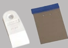
Резиновый и металлический шпатели