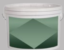
Мелкозернистая водорастворимая шпаклевка