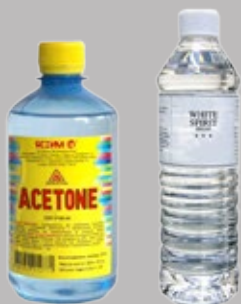
Ацетон или уайт-спирит