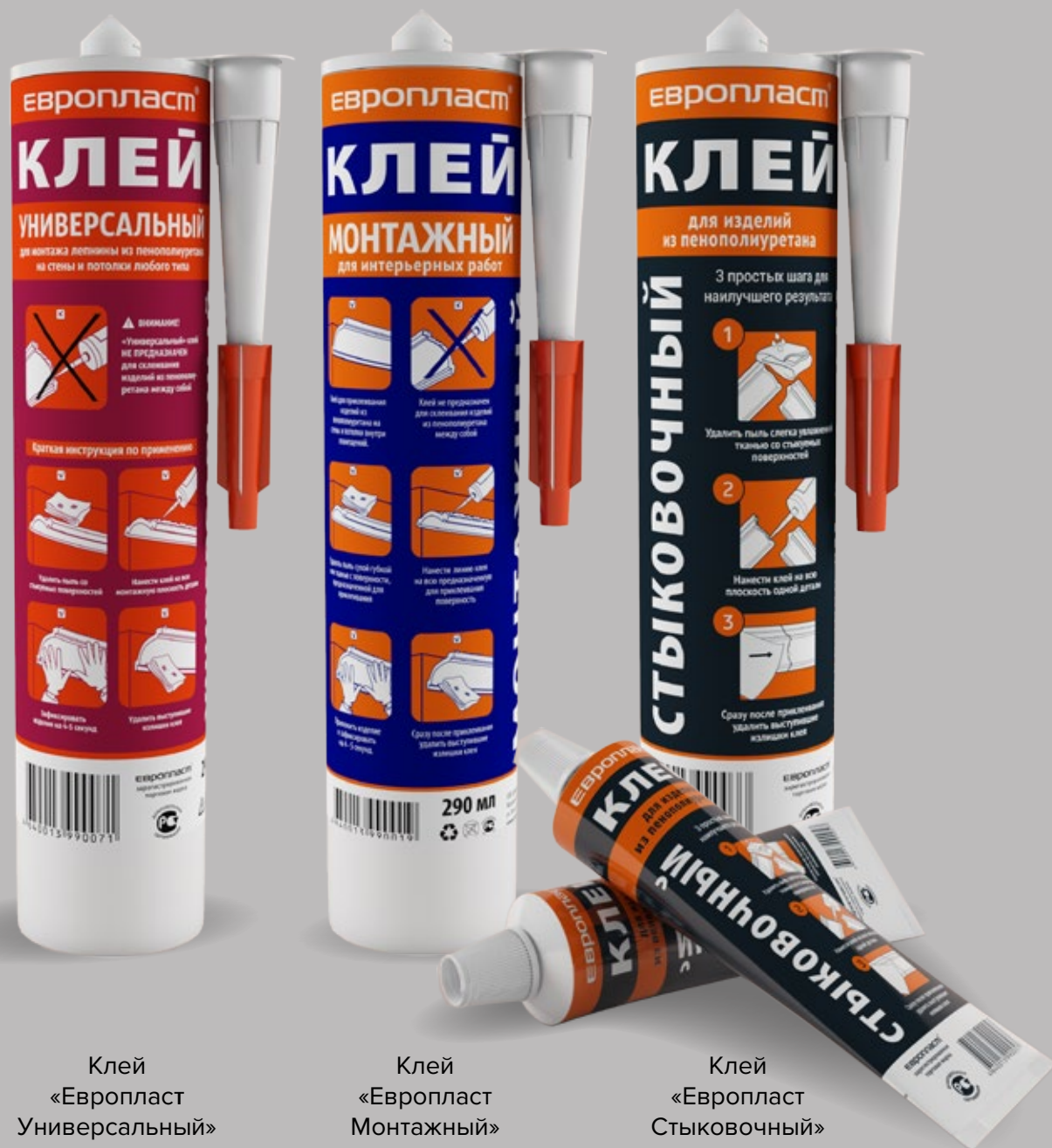
Клей «Европласт Универсальный»